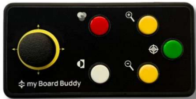
Controller my Board Buddy AIR a 5 pulsanti

Il controller presenta un design a misura di bambino con un semplice joystick sul lato sinistro e 5 (AIR) o 9 (CAM) pulsanti colorati sul lato destro: