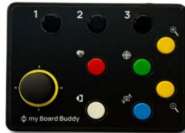
Controller my Board Buddy CAM a 9 pulsanti